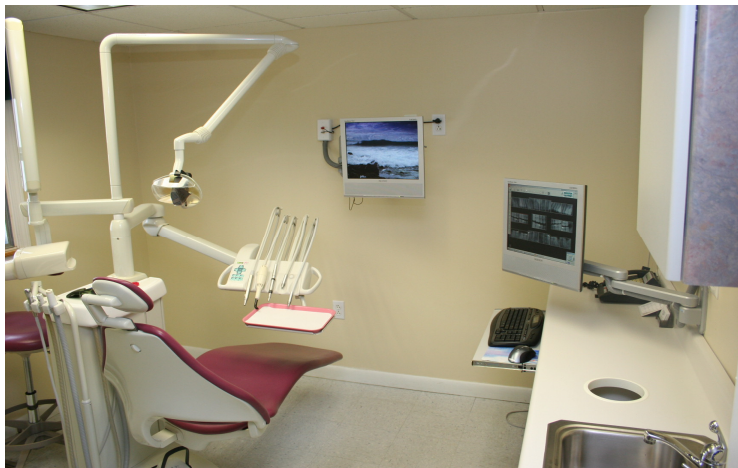
Dotare cabinete stomatologice

Personalul medical de specialitate care va desfășura activitatea în cadrul cabinetelor va fi evaluat de către Asociația AHAVA.